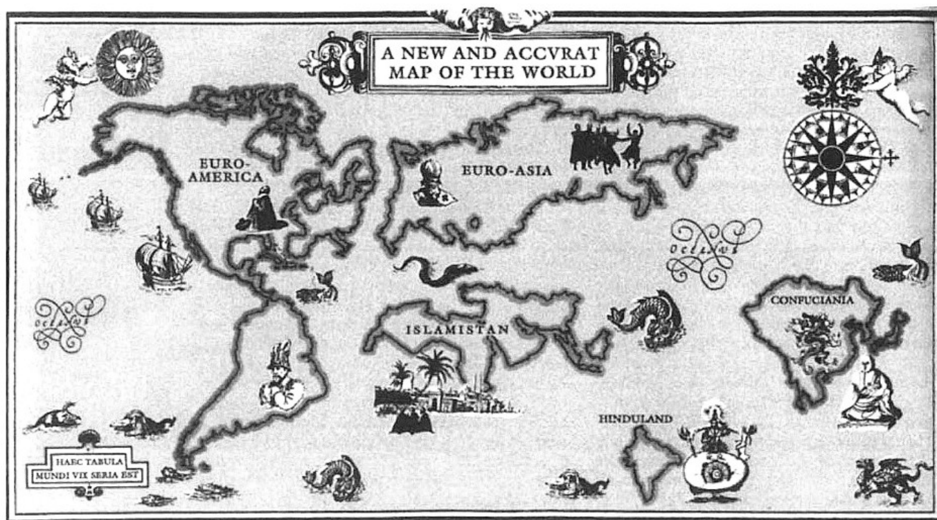
The 'new and accurat' map of the world published in September 1990 by The Economist

be. Rudolf Steiner így magyarázza a térképet: „A nyugati okkult testvériségek egész szimbólum-rendszere arra készíti az egyes embereket, sőt egész embertömegeket, hogy önző, különleges érdekek szolgálatába álljanak. ... Az a központ, ahonnan ezek az egészségtelen hatások indulnak, nem a francia „Nagy-Oriens”. Angliában kell ezt a központot keresni. A „Nagy-Oriens” ... teljesen külsődleges. Számos orosz nagyherceg volt a tagja. ... Az angol testvériség számára az 1914-es év volt a legmegfelelőbb idő szándékainak végrehajtására. Hiszen néhány év múlva lehetetlen lett volna, hogy háborút szítson Franciaország és Németország között. Akkor a gyűlöletet, a revansvágyat Franciaországban már nem lehetett volna felkantározni. Ezért megragadták az első alkalmat, hogy háborút indítsanak. ... Anglia (most már Amerikáról kell itt beszélni – a szerző) nem akar semmiféle békét, mivel célját – kiharcolni a világuralmat az ókori Római Birodalom mintájára – még nem érte el. A birodalom tapasztalatait gondosan tanulmányozzák, a hibáit szintén, hogy azokat ne ismételjék meg. Lloyd George ezeknek az erőknél a tudatos eszköze: ő teljesen mentes a puritanizmustól. ... Németországot szétépíteni, halálra juttatni az úgynevezett latin fajt, Oroszország felett gyámságot létrehozni – ennek az okkult testvériségnek az összes célját most el kell érni. Ezért – el a kezekkel a béketeremtés minden szándékától!