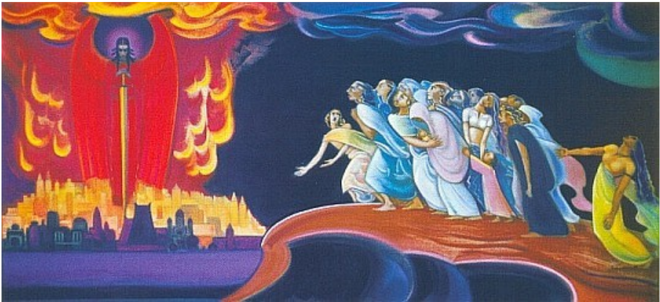
Szvjatoszláv Rerich: Figyelmeztetés az emberiség számára (Nézd, emberiség!). 1962 Святослав Рерих: Предупреждение человечеству. (Воззри, человечество!).