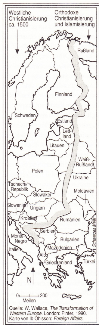
Karte 7.1 Die Ostgrenze der westlichen Zivilisation

De többet is mondanak. Például Kissinger a CNN számára adott nyilatkozatban ezt mondja: „Kijevet egykor Kijevi Rusznak hívták. Úgyhogy Oroszország politikai, sőt vallási fejlődése tehát Kijevvel kezdődött. Aztán volt egy szakadás, de a XVII. század végétől a XVIII. század elejéig Ukrajna Oroszország része volt. És nem ismerek egyetlen olyan oroszországit sem, függetlenül attól, hogy disszidens vagy kormányzati pozíciót tölt be, aki ne tartaná Ukrainát legalábbis az orosz történelem egyik legfontosabb részének. Az oroszok tehát nem lehetnek közömbösek Ukrajna jövője iránt. Hogy megértsük az orosz pozíciót, a történelemre kell tekintenünk.” Itt már Ukrajna Oroszországhoz való visszatérésének szólama hangzik. És erről nem egyszerűen egy volt külügyminiszter beszél, hanem egy olyan ember, aki bizonyos mértékben részese azoknak a köröknek, amelyek épp a világtörténelmet tervezik.